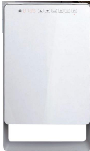
Radiator: Aurora touch